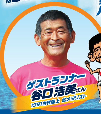
ゲストランナー 谷口浩美さん 1991世界陸上金メダリスト