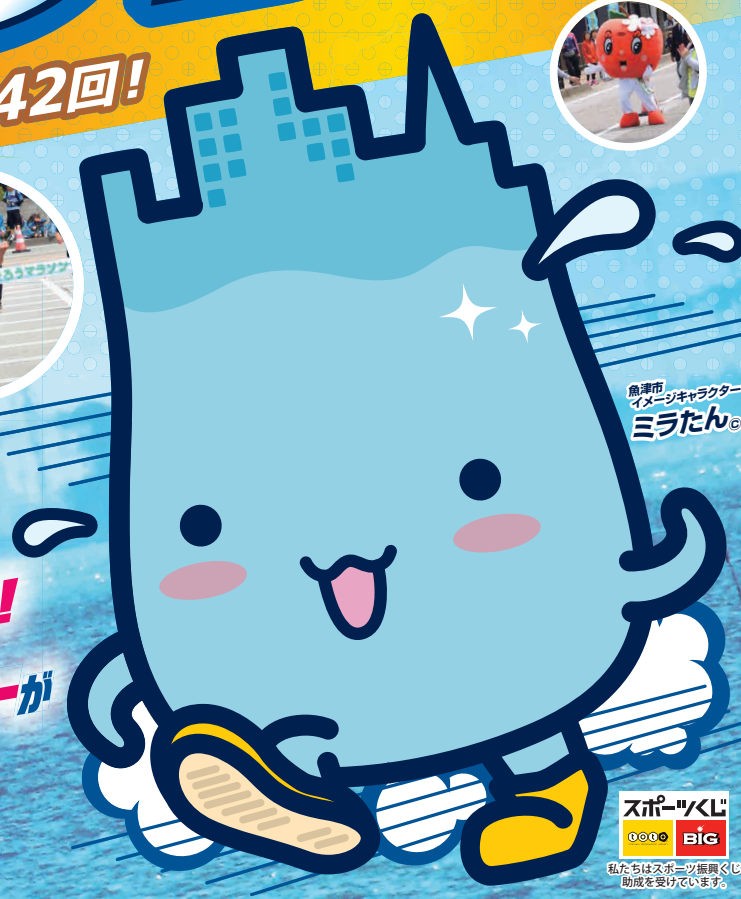
魚津市 イメージキャラクター ミラたん