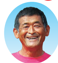
ゲストランナー 谷口 浩美さん 1991世界陸上金メダリスト